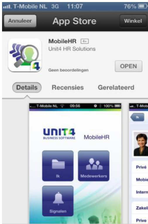
MobileHR App in App Store